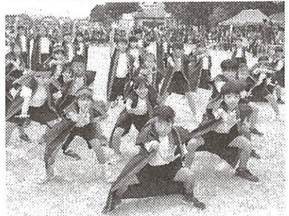
<高学年演技「蜂屋ソーラン」>