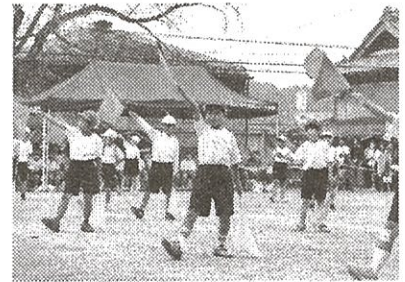
<低学年演技「ハニーバカンス」>

運動会は前期の終業式の翌日に実施しました。前期の活動で成長した蜂屋っ子の姿を保護者や地域の皆さまに見ていただけたと思います。運動会が終わり後期がスタートしています。引き続き、ご理解ご協力をよろしくお願いします。