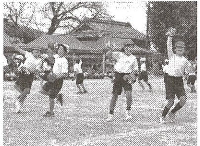
<中学年演技「できっこないをやらなくちゃ」>